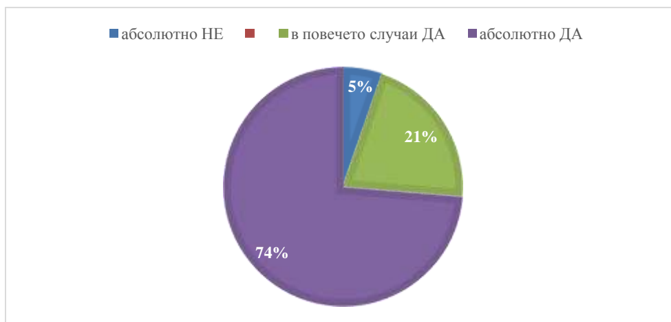
Фигура 4: Отговори на въпрос 4