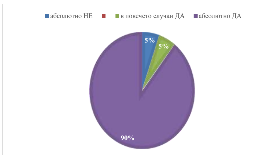
Фигура 3: Отговори на въпрос