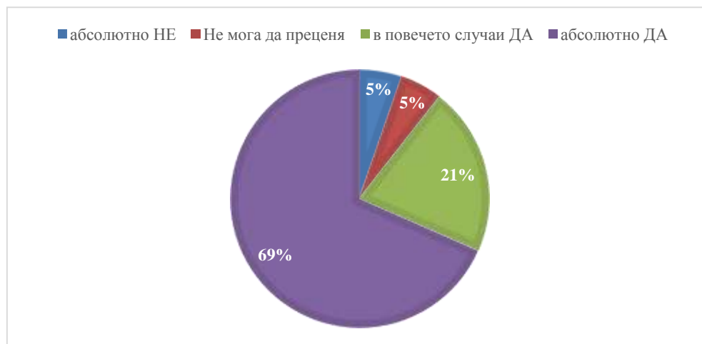
Фигура 5: Отговори на въпрос 5