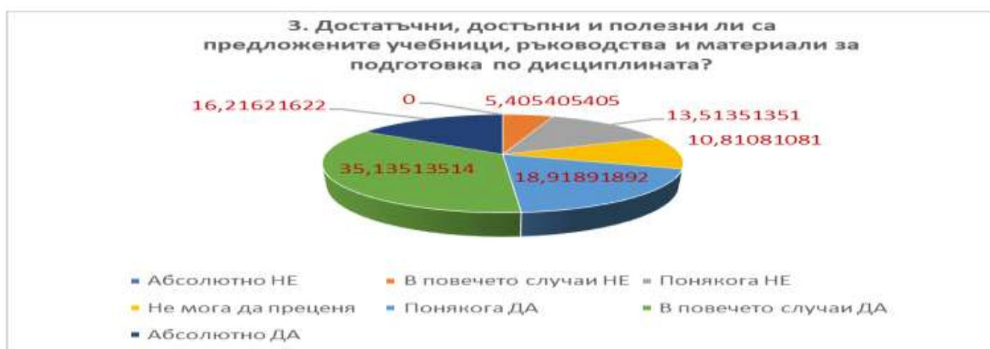
Фигура 3: Отговори на въпрос 3 за дисциплината БИОФАРМАЦИЯ, изразени в % от анкетираните