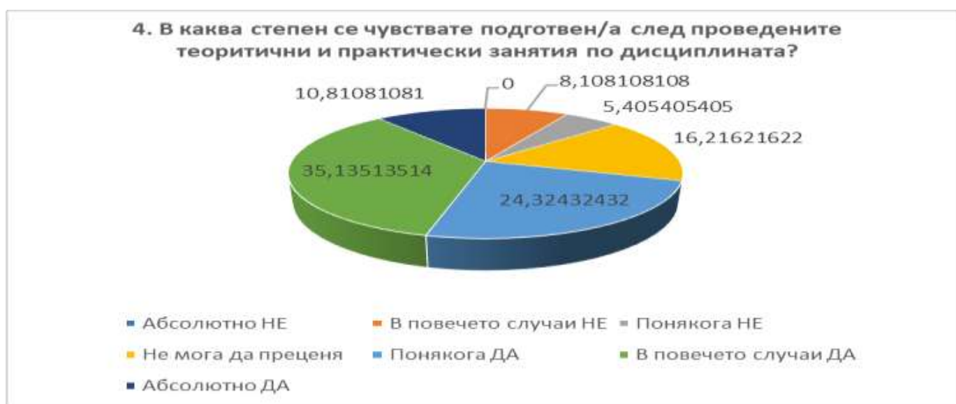
Фигура 4: Отговори на въпрос 4 за дисциплината БИОФАРМАЦИЯ, изразени в % от анкетираните.

Въпрос 5: Доволни ли сте от използваните методи на обучение?