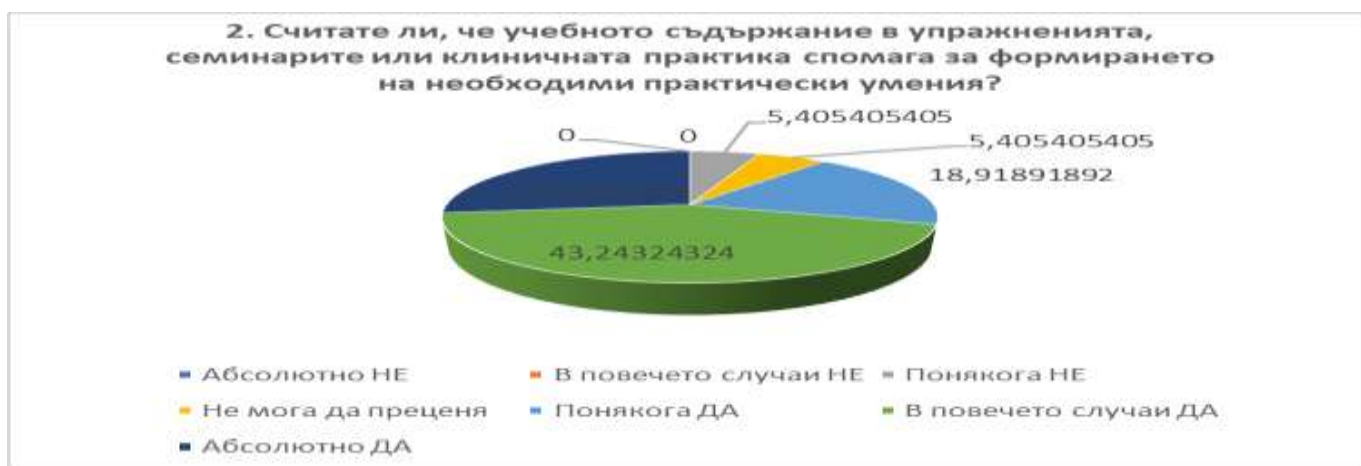
Фигура 2: Отговори на въпрос 2 за дисциплината БИОФАРМАЦИЯ, изразени в % от анкетираните

Въпрос 3: Достатъчни, достъпни и полезни ли са предложените учебници, ръководства и материали за подготовка по дисциплината?