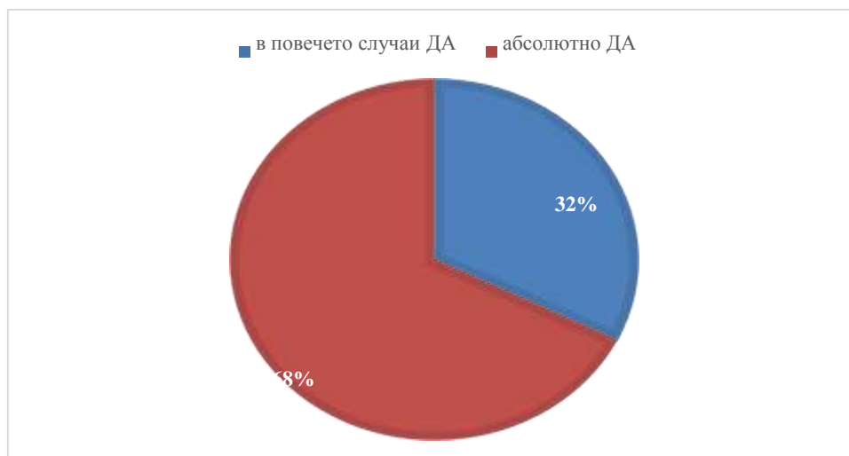
Фигура 4: Отговори на въпрос 4