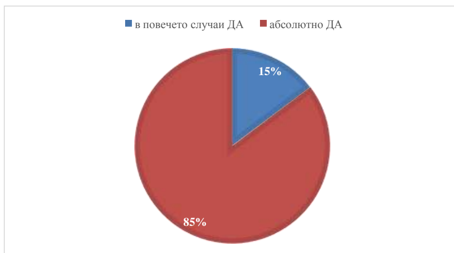
Фигура 1: Отговори на въпрос 1