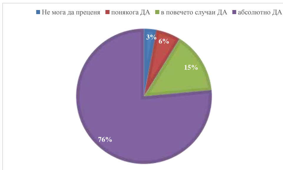
Фигура 2: Отговори на въпрос 2